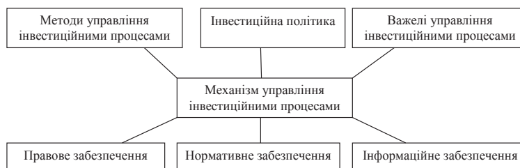
Рис. 1. Структура механізму управління інвестиційними процесами

Механізм управління інвестиційними процесами є складовою фінансового механізму, котрий, в свою чергу, є важливим елементом національної економіки. Він є необхідним для забезпечення нормальної безперервної роботи економічної системи, реалізації інвестиційної політики держави. На мікрорівні він забезпечує реалізацію інвестиційних процесів в організаціях, підприємствах.