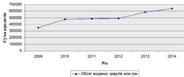
Рис. 1. Динаміка виданих кредитів суб'єктам господарювання впродовж 2009-2014 рр.

Динаміку обсягів банківського кредитування підприємств подано на рис. 1.