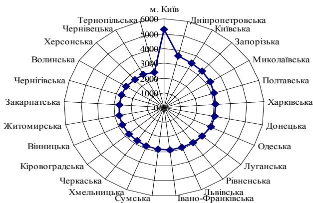
Рис. 2. Рейтинг середньомісячної заробітної плати за регіонами України станом на жовтень 2014 року

На рисунку 2 відображено дані рівня середньомісячної заробітної плати за регіонами України.