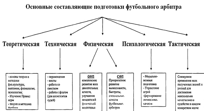
Рис. 1. Основные составляющие подготовки футбольного арбитра