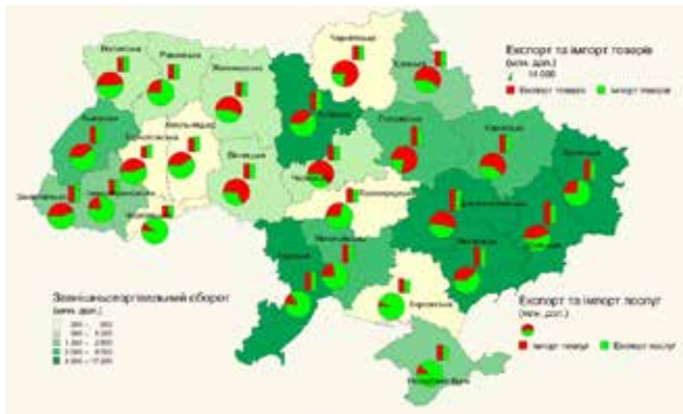
Рис. 2. Експорт, імпорт та зовнішньоторгівельний оборот у регіональному розрізі у 2012 році