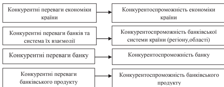
Рис. 1. Схема взаємозв'язку конкурентних переваг та конкурентоспроможності банків на різних рівнях управління

Висновки та пропозиції. Результати проведеного дослідження дозволяють дійти висновку, що, існує нерозривний зв'язок фінансової стратегії банків з їх