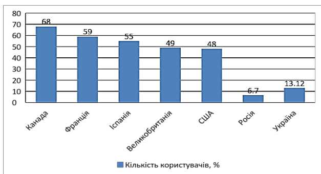
Рис. 5. Кількість користувачів Інтернет-банкінгом в країнах світу на початок 2014 року, %

Кількість банків, в яких є Інтернет-банкінг в Україні незначна – менше 20 банків. Причиною такого стану є недостатньо розвинена нормативна база, яка регулює роботу банків саме в мережі Інтернет. Проблема збереження банківської таємниці є особливо актуальною в такому відкритому середовищі, як «всесвітня мережа». Співвідношення кількості користувачів послугами дистанційного банківського обслуговування із загальною кількістю жителів серед розвинених країн світу та в Україні на початок 2014 року представлена на рис 5.