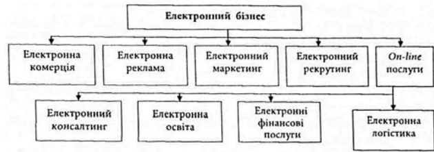
Рис. 2. Основні форми електронного бізнесу

нових та поліпшенню обслуговування старих клієнтів, більшій мобільності та оперативності щодо прийняття управлінських рішень [2, с. 213].