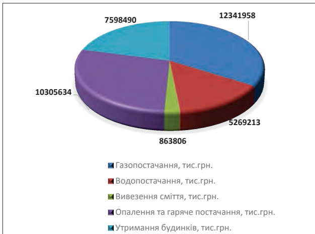
Рис. 2. Заборгованість населення за житлово-комунальні послуги за 2014 р.

За останній рік сплата за житлово-комунальні послуги не завжди відповідає обсягу нарахувань. Обсяг заборгованостей за комунальні послуги за підсумками 2014 року наведений на рис. 2 [7].