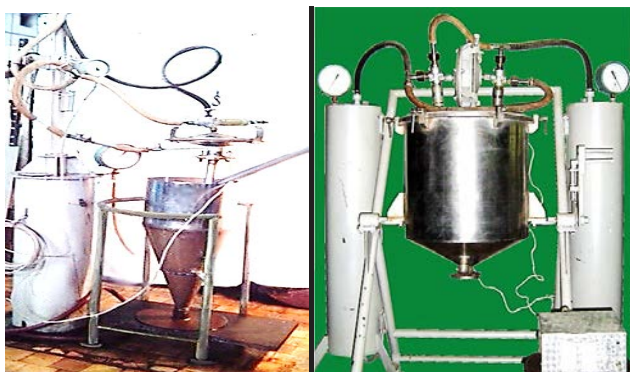
Рис. 1. Пульсаційні диспергатори для екстрагування з рослинної сировини

Лляний екстракт на основі сироватки в свою чергу був отриманий шляхом екстракції в пульсаційних диспергаторах з активною діафрагмою. В цих апаратах відбувається потужний кавітаційний вплив на дисперсну фазу, що і забезпечує інтенсивне виділення біоактивних речовин в об'єм розчинника. В різних галузях промисловості використовують ефективні технології, в основі яких застосовують пульсаторні агрегати дискретно-імпульсного введення енергії (ДІВЕ) з періодичним змінням тиску в робочій камері. Метод ДІВЕ реалізує принципово новий підхід до інтенсифікації тепломасообмінних та гідромеханічних процесів в дисперсних системах [7]. Пульсаторні агрегати дискретно-імпульсного введення енергії зображені на рисунку 1.