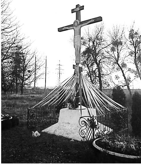
Фото 4. Сmt Крижопіль Крижопільського району Вінницької області. 04.02.2015 р. фото автора. Комплекс з придорожнім хрестом: бетонна основа, розп'яття Ісуса, невеликий паркан, квітники для живих квітів, рушники, різнокольорові стрічки, штучні квіти. Хрест латинський трираменний

до хреста, що стояв на перехресті при в'їзді у м. Калинівку, під'їхали та почали стріляти, за різними даними від одного до трьох більшовиків. Одна із куль влучила у розп'яття прикріплене до хреста і з утвореного отвору почала витікати рідина червоного кольору [3, с. 50, 56; 13, с. 43]. Народна уява пояснила це як чудо кровоточіння і до хреста почали сходитись віряни. Радянська влада силовими та судовими методами припинила масові паломництва до хреста, а у вирокі суду вказувалось: «головних організаторів, керівників та визискувачів «чуда» – позбавити волі на 5 літ з суворою ізоляцією; активних співробітників «чуда» – на 3 роки» [2, № 29, с. 3].