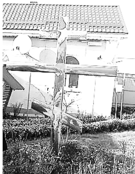
Фото 10. смт Вапнярка Томашпільського району Вінницької області. 05.02.2015 р. Поклінний хрест на території Свято-Феодорівського чоловічого монастиря. Хрест дубовий, оббитий оцинкованою бляхою золотистого кольору. Хрест латинський трираменний

Окрему групу складають пам'ятні хрести, встановлені на місцях бойових дій, спільних могилах полеглих у боях Другої світової війни, як пам'ятники жертвам голодоморів. До них віряни ставляться так само як і до придорожніх хрестів, при відвідуванні поминають полеглих.