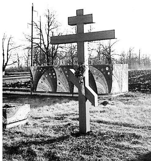
Фото 3. Село Голубече Крижопільського району Вінницької області. 04.02.2015 р. фото автора. Дерев'яний хрест, вкопаний у землю, прикрашений рушником та хусткою. Хрест латинський трираменний