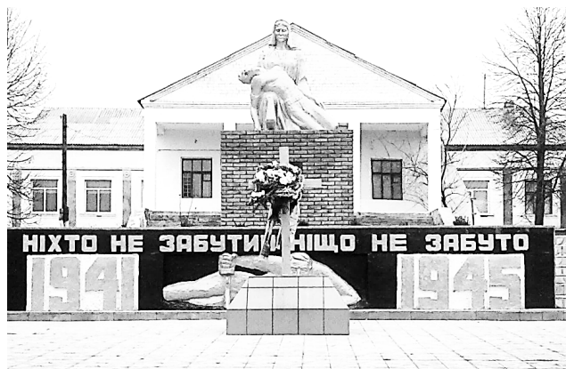
Фото 11. Село Тернівка Крижопільського району Вінницької області. 02.02.2015 р. фото автора. Пам'ятний хрест у комплексі пам'ятника загиблим у роки Другої світової війни. Прикрашений вінками і штучних квітів. Хрест латинський однорамний

Христа над смертю, тому і ставитись ми до нього повинні благоговійно» [5].