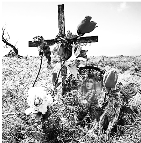
Фото 9. Автоtrasа з м. Немирів за 5 км с. Ковалівка. 13.08.2015 р. Хрест на місці аварії, де загинула дитина. Штучні квіти та іграшки приносять рідні

Поклінні хрести біля релігійних установ. Зазвичай це дерев'яні хрести, такого ж типу як придорожні. Без особливих прикрас. Встановлюють їх, як правило, перед початком будівництва релігійного об'єкту (каплиця, церква, костел, монастир) для означення «присутності в цьому місці божої благодаті».