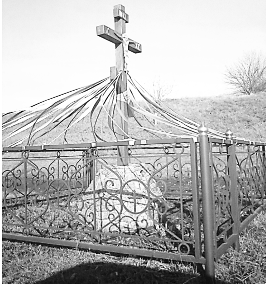
Фото 5. Село Городківка Крижопільського району Вінницької області. 01.02.2015 р. Комплекс з придорожнім хрестом: бетонна основа, розп'яття Ісуса, невеликий паркан, рушники, різнокольорові стрічки. Хрест латинський трираменний

Калинівський хрест є одним із паломницьких центрів на Вінниччині. Сюди щороку на початку липня приходять велелюдні хресні ходи. Пам'ять про чудо з хрестом жила в народі, і хоч оригінальний хрест було знищено, на його місце кілька разів ставили новий. У 1993 році на місці чуда було встановлено новий дубовий хрест, що стоїть зараз у спеціально збудованій церкві-каплиці, у якій відправляються служби місцевими та приїжджими священиками. Відновлено традицію хресних ходів з Вінниці до Калинівки. У 2003 році Калинівському чуду виповнилось 80 років. У хресній ході, яка розпочалась у Вінниці і до якої дорогою долучались усі бажаючі, взяло участь 11 тисяч прочан [14, с. 1].