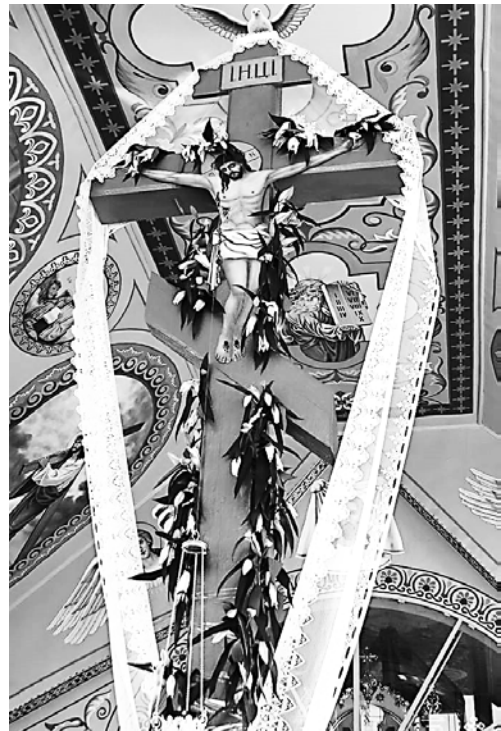
Фото 6. Місто Калинівка Калинівського району Вінницької області. 02.06.2015 р. фото автора. Калинівський хрест, покритий святковим покривалом та прикрашений штучними квітами. Хрест латинський трираменний.

Калинівський хрест є одним із паломницьких центрів на Вінниччині. Сюди щороку на початку липня приходять велелюдні хресні ходи. Пам'ять про чудо з хрестом жила в народі, і хоч оригінальний хрест було знищено, на його місце кілька разів ставили новий. У 1993 році на місці чуда було встановлено новий дубовий хрест, що стоїть зараз у спеціально збудованій церкві-каплиці, у якій відправляються служби місцевими та приїжджими священиками. Відновлено традицію хресних ходів з Вінниці до Калинівки. У 2003 році Калинівському чуду виповнилось 80 років. У хресній ході, яка розпочалась у Вінниці і до якої дорогою долучались усі бажаючі, взяло участь 11 тисяч прочан [14, с. 1].