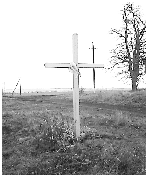
Фото 1. с. Жабокрич Крижопільського району Вінницької області. 02.02.2015 р. фото автора. Хрест дерев'яний пофарбований та перев'язаний хусткою. Хрест латинський однорамений

Встановлюють їх церковні громади, якщо ж у населеному пункті кілька церков, то кожна встановлює свій хрест.