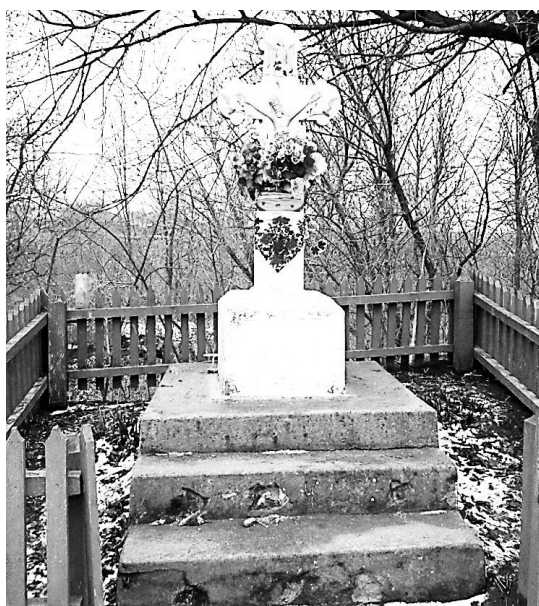
Фото 8. с. Городківка Крижопільського району Вінницької області. 30.01.2015 р. Комплекс із кам'яним придорожнім хрестом на бетонному цоколі зі сходами: кам'яний побілений хрест витесаний з піщаника, прикрашений штучними квітами та хустками, невеликий паркан. Встановлений на перехресті вулиць Гагаріна і Трублаїні. Хрест латинський однорамний.

Поклінні хрести біля релігійних установ. Зазвичай це дерев'яні хрести, такого ж типу як придорожні. Без особливих прикрас. Встановлюють їх, як правило, перед початком будівництва релігійного об'єкту (каплиця, церква, костел, монастир) для означення «присутності в цьому місці божої благодаті».