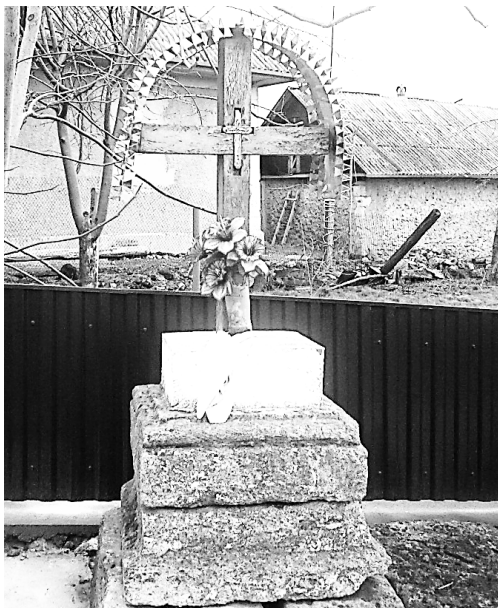
Фото 7. Село Жабокрич Крижопільського району Вінницької області. 01.02.2015 р. фото автора. Дерев'яний хрест, встановлений на кам'яну основу, прикрашений хусткою та штучними квітами. Для часткового збереження деревини від впливу опадів, зверху прилаштовано дашок із оцинкованої бляхи. Встановлений на перехресті вулиць Поділля та Шевченка. Хрест латинський однорамний.