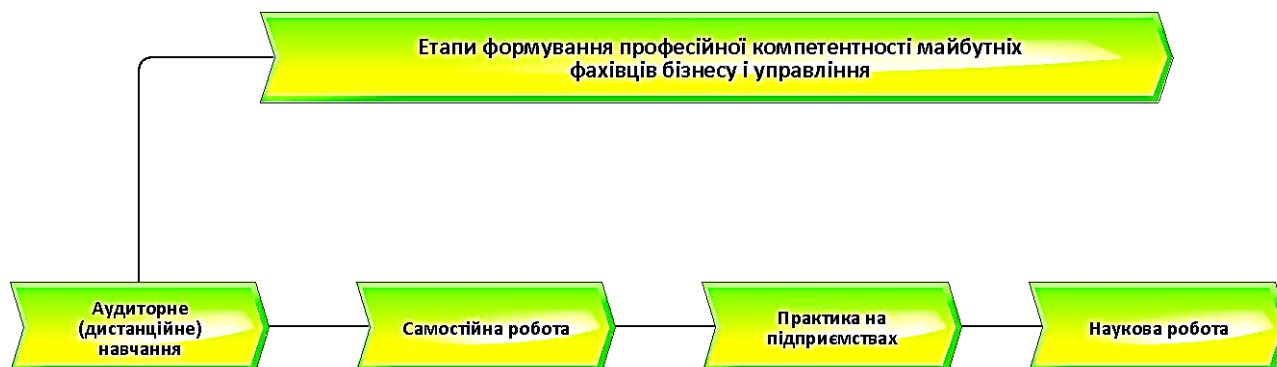
Рис. 1. Процеси формування професійної компетентності майбутніх фахівців бізнесу і управління

Виклад основного матеріалу. Дане дослідження проводиться у контексті розробки теми формування професійної компетентності майбутніх фахівців бізнесу та управління засобами інтерактивного навчання. Пояснення процесного підходу в освіті зарубіжними вченими тотожне трактуванню інтерактивного навчання в українській педагогіці. Так, С. О. Сисоева у посібнику «Інтерактивні технології навчання дорослих» [9, с. 34] зазначає, що інтерактивне навчання є одним із сучасних напрямів активного соціально-психологічного навчання, у якому суб'єкт навчальної діяльності вступає в діалог з викладачем, бере активну участь у пізнавальному процесі, виконуючи творчі, пошукові, проблемні завдання у парі, групі. О. І. Пометун у праці «Енциклопедія інтерактивного навчання» [6, с. 6] розкриває його як організацію вчителем освітнього процесу, заснованого на суб'єкт-суб'єктних стосунках педагога і учня, багатосторонній комунікації, конструю-