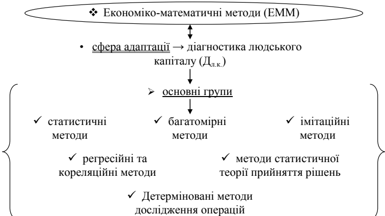
Рис. 2. Схема видової структури ЕММ в D_{л.к.}

Висновки та пропозиції. Удосконалення методичних сегментів діагностики людського потенціалу, на нашу думку, має відбуватися на основі адаптації методів економіко-математичного моделювання. Вибір методів економіко-математичного моделювання доцільно проводити у відповідності до завдання та мети аналітичної оцінки поведінки