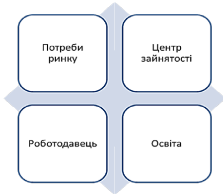
Рис. 2. Механізм факторів впливу на попит на ринку праці

Метою державного управління професійною збалансованістю на ринку праці є забезпечення всіх сфер життєдіяльності держави кваліфікованими кадрами, необхідними для реалізації національних інтересів у контексті розвитку України як демократичної, соціальної держави з розвинутою ринковою економікою.