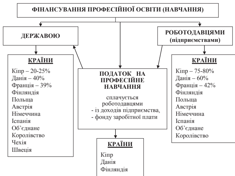
Рис. 3. Світовий досвід фінансування професійної освіти

В основу реорганізації системи надання послуг, що надаються державними і комунальними професійно-