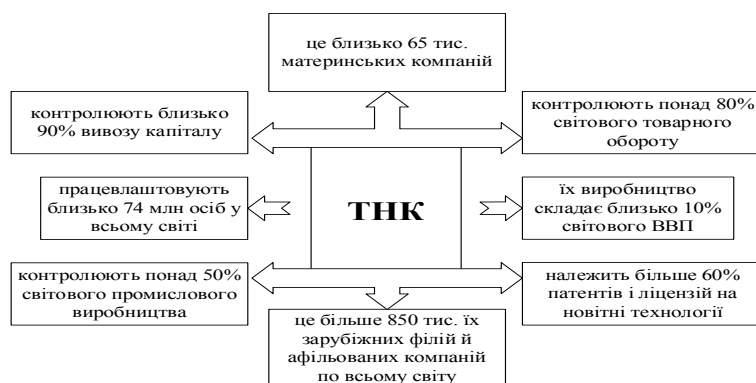
Рис. 1. Сучасний етап транснаціоналізації світової економіки

Цікавим є той факт, що, якщо раніше ТНК мали на меті лише посилити свою експансію на нові ринки, яка збільшувала оборот і прибутки за рахунок дешевших ресурсів виробництва (робочої сили, сировини), то на сучасному етапі вони прагнуть диверсифікувати власні ризики за рахунок по-