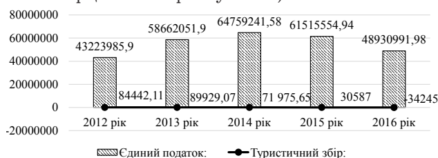
Рис. 3. Теперішні і прогнозні значення єдиного податку та туристичного збору за 2012-2016 роки, грн.

Підсумовуючи отримані значення, можемо сказати, що прогнозні дані свідчать про падіння ролі єдиного податку та туристичного збору у наповненості бюджету м. Суми у наступних двох роках, отже, місцевому самоврядуванню слід негайно шукати альтернативні варіанти поповнення бюджету за рахунок «не діючих у повній мірі» місцевих податків та зборів: податку на майно, збору за місця для паркування транспортних засобів і т. п. Особлива увага приділяється першому з них, отже, пропонуємо здійснити вище перелічені заходи з приводу розширення сфери застосування податку на майно (стягувати не тільки з житлових приміщень, а й з ділянок виробничого чи комерційного користування).