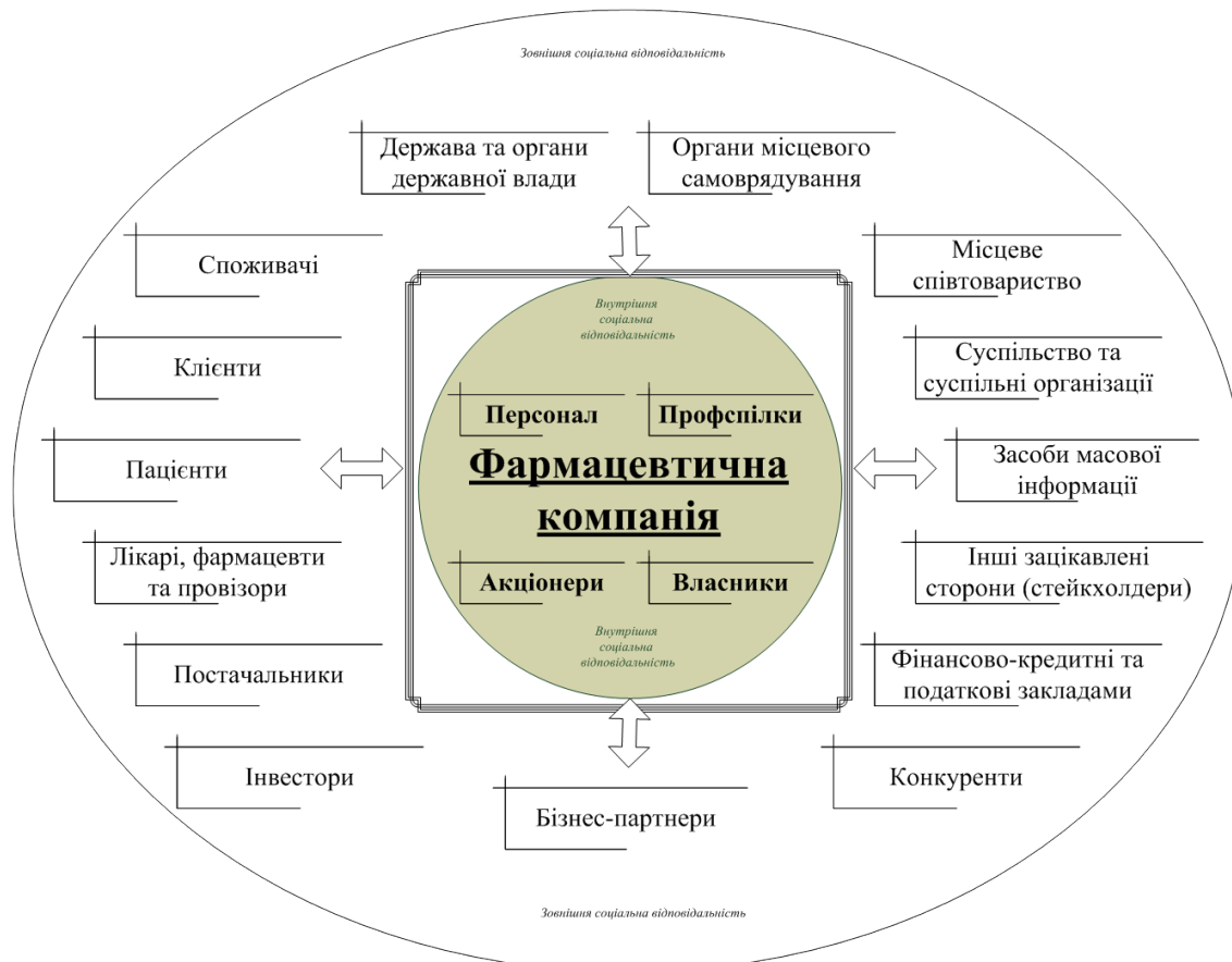
Рис. 2. Об'єкти (стейкхолдери) соціальної відповідальності фармацевтичного бізнесу