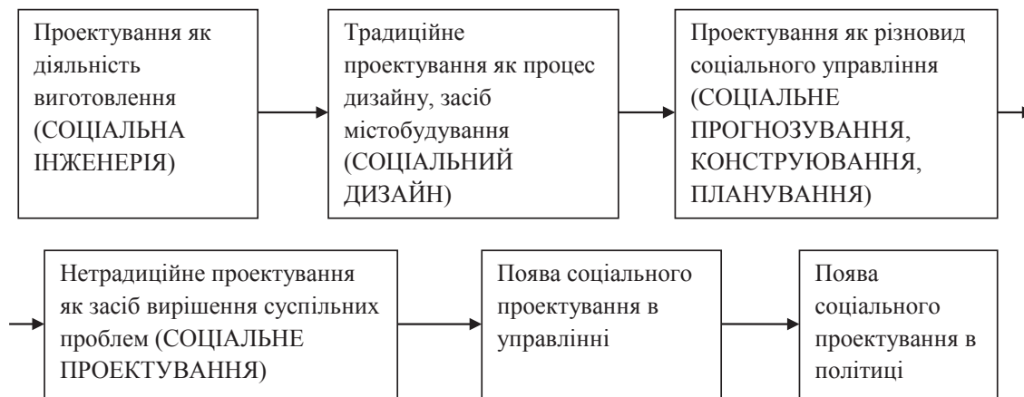
Схема 1. Розвиток соціального проектування

Соціальне проектування в державному управлінні з'являється саме у розрізі підготовки та реалізації державно-управлінських рішень, підготовки та впровадженні державних реформ, створення соціальних та державних програм, стратегій, концепцій, нормативно-правових актів, які направлені на підвищення показників рівня життя в країні. Необхідність швидкої реакції, гнучкості та адаптивності до зовнішніх змін органів державного управління, а також безпосередньо самих державних службовців вимагає використання нових методів в їх діяльності, в результаті чого з'являється соціальне проектування в управлінні,