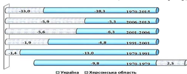
Рис. 2. Обсяги скорочення чисельності сільського населення України та Херсонської області, %