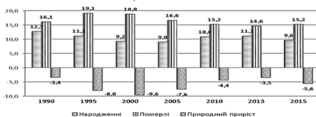
Рис. 3. Загальні коефіцієнти народжуваності, смертності та природного приросту населення у сільській місцевості України