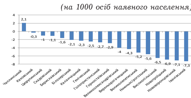
Рис. 5. Ранжування районів Херсонської області за коефіцієнтом природного приросту (скорочення) сільського населення в 2015 році

5,0 до 7,5) – віддаленні райони від обласного центру – Іванівський, Нововоронцовський, Новотроїцький, Високопільський, Нижньосірогозький та Великолепетиський (рис. 5). При цьому, слід відмітити, що лише у Чаплинському районі відбувся природний приріст сільського населення, який становив 47 осіб [5].