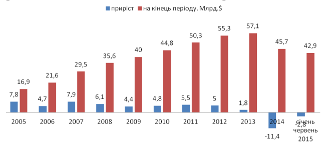
Рис. 1. Обсяг прямих іноземних інвестицій в національну економіку за 2005-2015 рр. [2]

За даними Держстату у січні-червні 2015 року в економіку України іноземними інвесторами вкладено 1042,4 млн. дол. США та вилучено 351,3 млн. дол. США прямих інвестицій (акціонерного капіталу). Зменшення капіталу за рахунок переоцінки, утрат та перекласифікації, за даними Держстату, за цей період становить 3604,0 млн. дол. США (у т. ч. за рахунок курсової різниці – 3539,3 млн. дол. США) (рис. 1) [2].