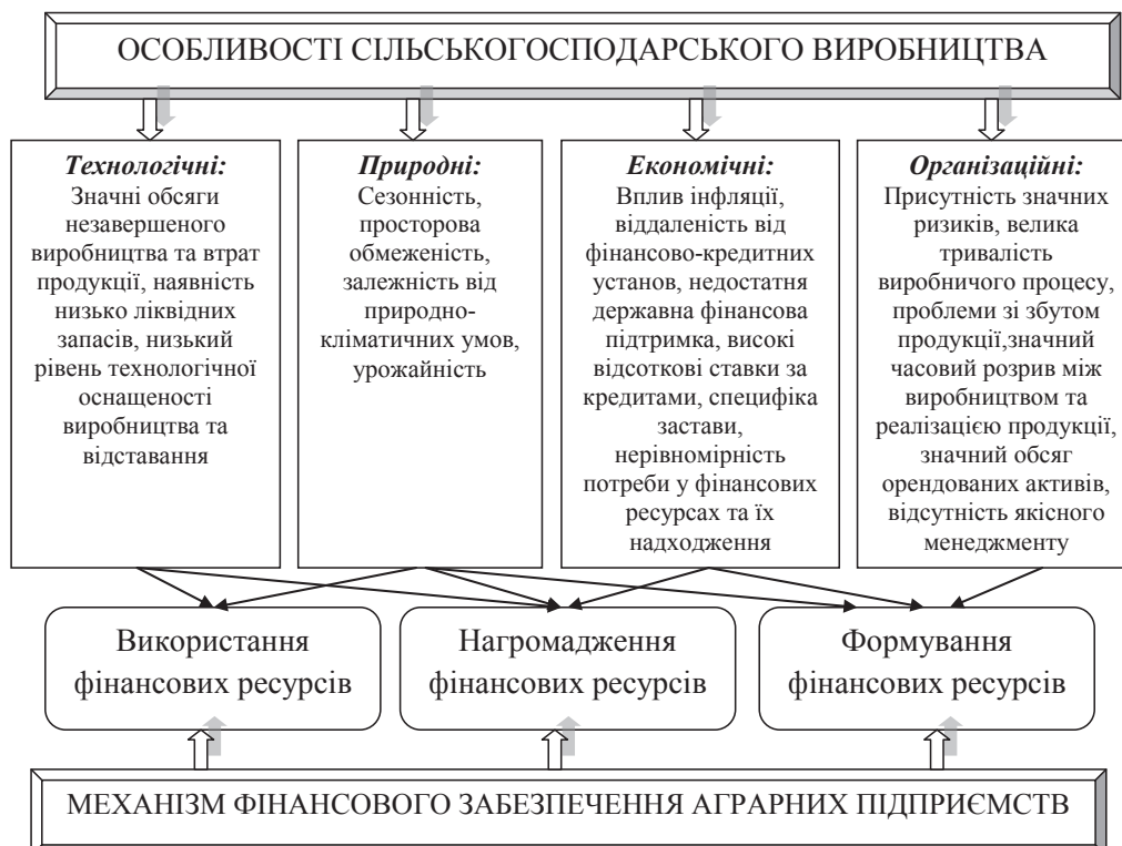
Рис. 2. Особливості сільськогосподарського виробництва на фінансове забезпечення аграрних підприємств [5]

При цьому оптимальний варіант фінансової політики аграрних підприємств полягає у розробці напрямів залучення та використання фінансових ресурсів на перспективу з метою досягнення стратегічних й тактичних цілей підприємства, за якого: доходи мають формуватися та використовуватися відповідно до масштабів виробництва і реально поставлених завдань, з урахуванням залежності фінансових надхо-