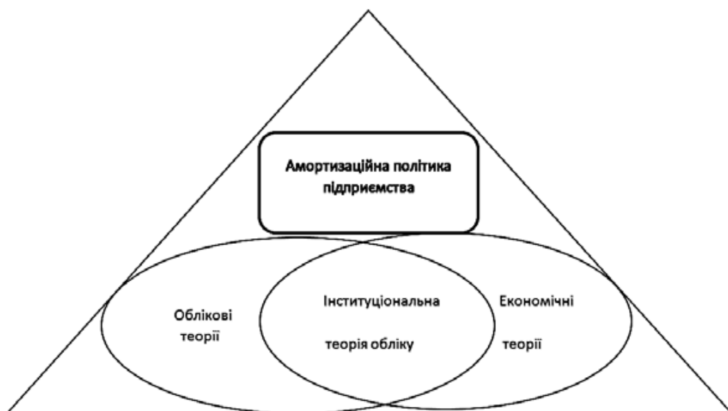
Рис. 2. Місце амортизаційної політики в економічних і облікових теоріях

Поглиблено інтерпретацію облікової складової сутності амортизаційної політики підприємства з урахуванням особливостей і принципів фінансово-економічного механізму відтворення. Таким чином формування амортизаційної політики підприємства передбачає використання складових системи бухгалтерського обліку, а саме інформаційну мережу, з каналами, по яких надходять дані про стан об'єктів обліку (основних засобів, амортизаційних відрахуваннях тощо).