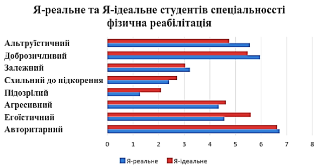
Рис. 3. Я-реальне і Я-ідеальне студентів спеціальності фізична реабілітація