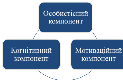
Рис. 1. Модель психологічної готовності до професійної діяльності фахівця з фізичної реабілітації

Ми обрали для діагностування суто психологічні конструкти, якими є особистісний та мотиваційний, компоненти.