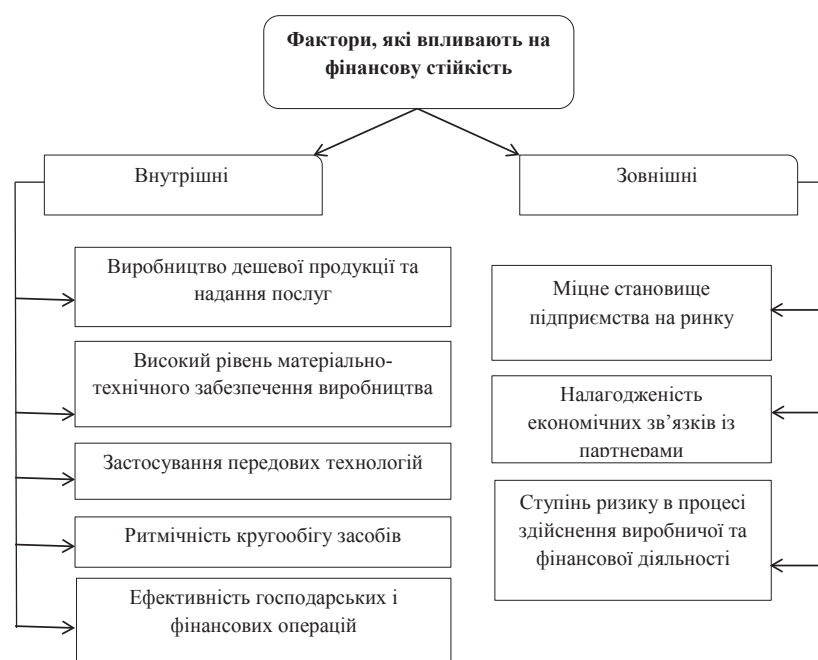
Рис. 2. Сукупність факторів впливу на фінансову стійкість підприємства