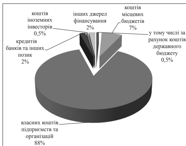
Рис. 2. Структура інвестицій за джерелами фінансування на розвиток сільськогосподарських підприємств Дніпропетровської області за 2016 рік, %*

За наведеними даними, можемо зробити висновок, що у структурі капітальних інвестицій сільськогосподарських підприємств Дніпропетровської області найбільшу питому вагу серед