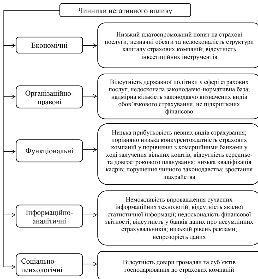
Рис. 3. Чинники негативного впливу на розвиток страхового ринку в Україні