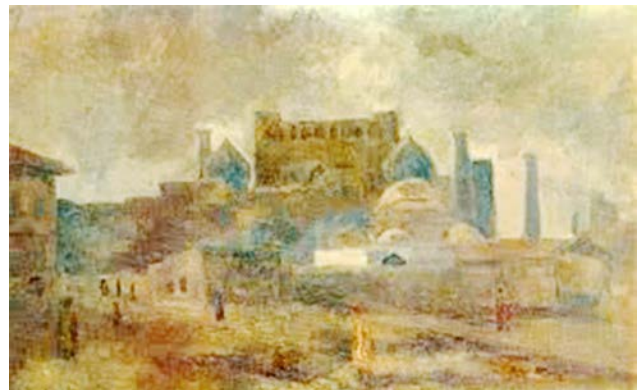
Рис. 3. Фальк Р.Р. «Регистан зимой. Самарканд». 1939 г. Х, м. 80,0 X 120,0 см. // Частное собрание, Санкт-Петербург

Всемирно известную площадь древнего города – «Регистан» Р.Р. Фальк писал дважды, зимой 1939 года и осенью 1943 года. Образ зимнего Самарканда величественно прекрасен и меланхоличен. Он овеян неуловимым дыханием минувшего (рис. 3).