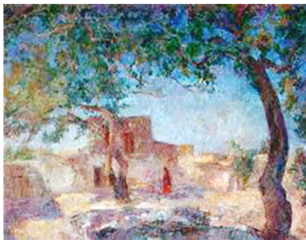
Рис. 5. Фальк Р.Р. «У хауса. Самарканд». 1943 г. Х., м. 65,0 X 80,0 см. // Государственный музей искусства народов Востока, Москва

поэтически проникновенные образы создавала его кисть. Осенью 1943 года Р.Р. Фальк написал картину «У хауса. Самарканд» (1943) (рис. 5).