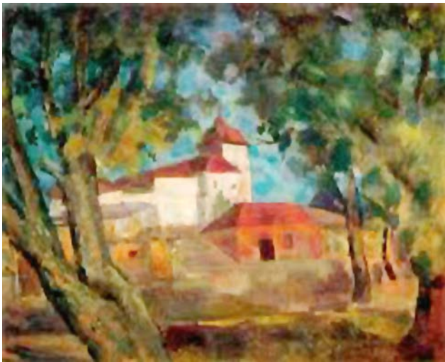
Рис. 8. Фальк Р.Р. «Хотьково. Монастырь». 1954 г. Х., м. 72,0 X 89,0 см. // Музей-усадьба «Абрамцево», Московская область

Загорск предстал перед Р.Р. Фальком в тихой красоте своей обыденности и традиционности; художник воспел его деревянные заборы и бревенчатые дома, скромный быт обитателей и их простое повседневное бытие (рис. 9).