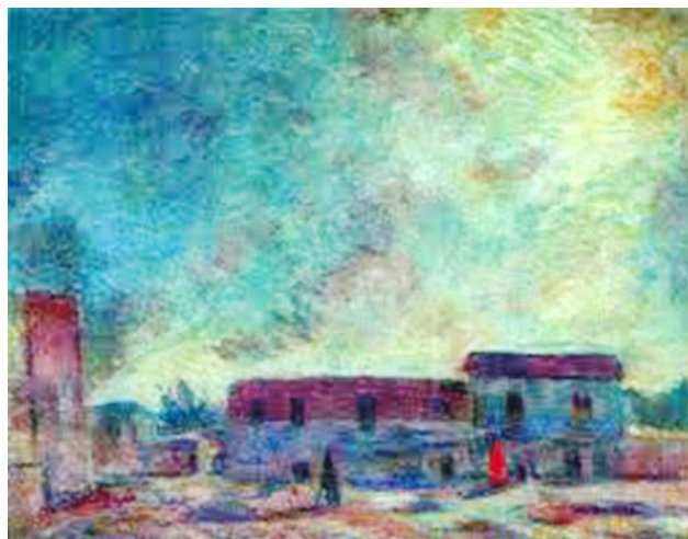
Рис. 6. Фальк Р.Р. «Самарканд». 1943 г. Х., м. 80,0 X 103,0 см. // Частное собрание, Санкт-Петербург

В полотне «Самарканд» (1943) выражено состояние природы в тот предвечерний час, когда все охватывает чуткое и недолгое затишье (рис. 6).