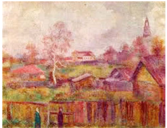
Рис. 9. Фальк Р.Р. «Загорск. Осень». 1955–1956 гг. Х., м. 65,0 X 81,0 см. // Частное собрание

из них – портрет теоретика и историка искусства А.Г. Габричевского (1952–1953 гг.) (рис. 10).