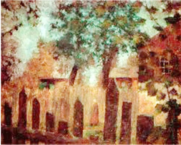
Рис. 7. Фальк Р.Р. «Забор. Хотьково». 1946 г. Х., м. 60,8 X 81,0 см. // Частное собрание, Москва

удивительно «тихими» и скромными [5, с. 25]. Цикл «философской лирики» составляют подмосковные пейзажи, написанные в Загорске и в Хотькове [9, с. 37] (рис. 7, 8).