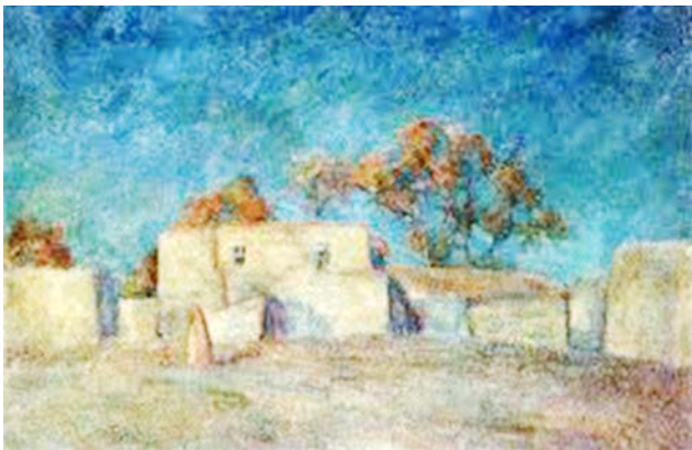
Рис. 2. Фальк Р.Р. «Золотой пейзаж (Золотой пустырь)». 1943 г. Х, м. 65,0 X 80,0 см. // Государственная Третьяковская галерея, Москва

Таков мотив «Золотого пустыря» (1943) – картины поистине «золотой», благодаря блестящему живописному истолкованию темы (рис. 2).