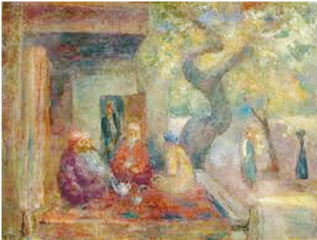
Рис. 1. Фальк Р.Р. «Чайхана. Самарканд». 1938 г. Х, м. 64,0 X 82,0 см. // Государственный музей искусств Узбекской ССР, Ташкент

и истомы пронизывает все. Поэтому так величавы и невозмутимы здесь старики, с достоинством совершающие неторопливый ритуал чаепития, и так неслышно, плавно скользят закутанные с головы до пят в паранджу женские фигурки.