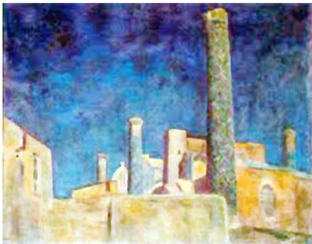
Рис. 4. Фальк Р.Р. «Регистан». 1943 г. Х., м. 64,0 X 81,0 см. // Государственный Русский музей, Санкт-Петербург

«Регистан» 1943 года – это гимн вечной силе и могуществу человека, природы и искусства. Р.Р. Фальк изобразил «Регистан» с задворок, где нет великолепного изразцового убранства, и архитектура предстает во всей своей суровой обнаженной, первозданной мощи (рис. 4).