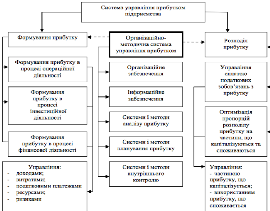
Рис. 3. Структурна схема управління прибутком підприємств