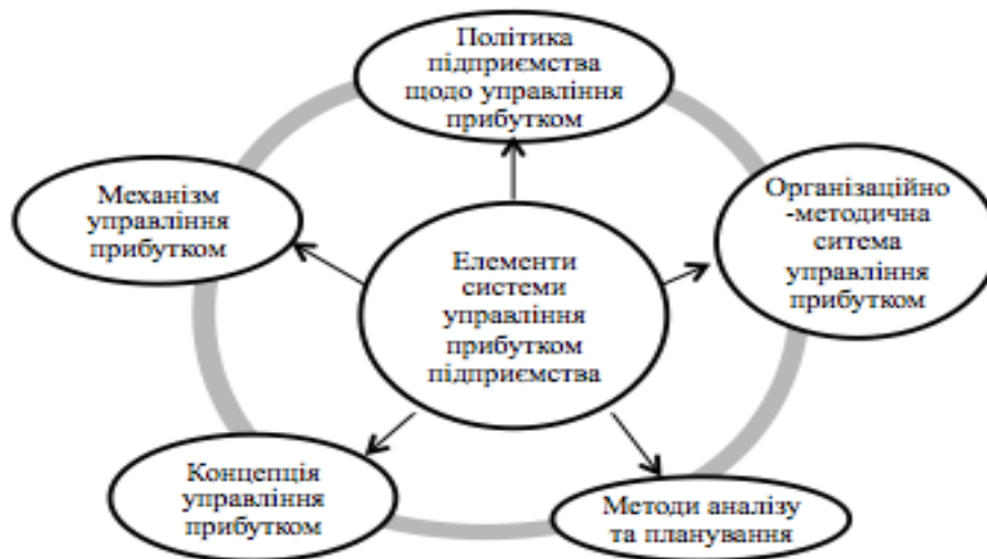
Рис. 2. Складові елементи системи управління прибутком підприємства