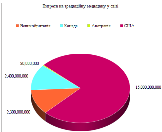
Рис. 2. Витрати на нетрадиційну медицину у світі

Нетрадиційна медицина в останні роки впевнено займає свою нішу в усьому світі. Послугами народних лікарів користуються понад 100 мільйонів європейців: з них половина звертаються до них регулярно і стільки ж віддають перевагу класичній медицині, що включає в себе елементи альтернативної [2]. Набагато поширеніша ця сфера в Африці, Азії, Австралії і Північній Америці. Так, витрати на нетрадиційну медицину в рік у Великобританії, Канаді та Австралії склали 2,3 млрд, 2,4 млрд. і 80 млн. доларів відповідно. Однак, найбільш вражаючими є інші цифри – за ці самі послуги громадяни США платять близько 15 млрд доларів у рік (рис. 2).