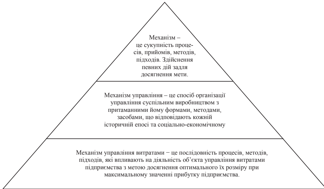
Рис. 1. Структура поняття «механізм управління витратами»

Для формування механізму управління витратами сільськогосподарських підприємств у позаштатних ситуаціях необхідно використовувати наступні елементи: фінансово-економічні методи управління; фінансово-економічні важелі управління; правове забезпечення процесу управління; нормативне забезпечення процесу управління; інформаційне забезпечення процесів управління.