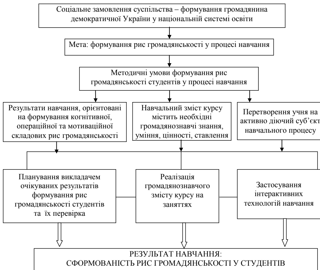
Схема 3. Методична модель формування рис громадянськості

– навчальний зміст містить необхідні громадянськознавчі знання, способи діяльності, цінності, ставлення;