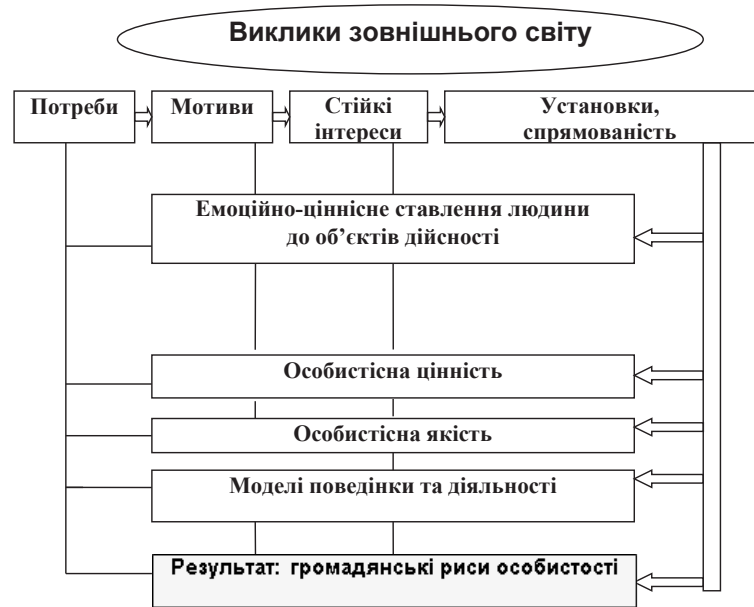
Схема 1. Психологічний механізм формування рис громадянської особистості

(особистісне емоційне ставлення людини до подій, фактів, явищ оточуючої дійсності, пов'язаних з відповідними сферами життя суспільства, до самої себе як громадянина) і операційна (розвиненість у особи сукупності узагальнених і спеціальних, аксіологічних та інших прийомів навчальної діяльності, які є основою формування громадянських установок, цінностей і відповідної спрямованості особистості). Якісний рівень розвитку цих складових