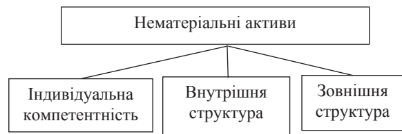
Рис. 1. Структура інтелектуального капіталу за К.-Е. Свейбі

Відповідно до визначення К.-Е. Свейбі, індивідуальна компетентність – це здатність людей діяти в різних ситуаціях. Вона включає вміння, знання, досвід, цінності, соціальні навички. Внутрішня структура компанії складається