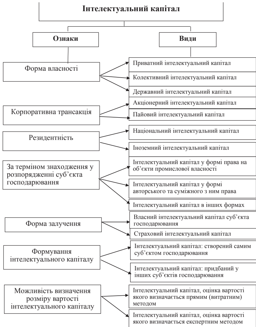
Рис. 3. Класифікація видів інтелектуального капіталу