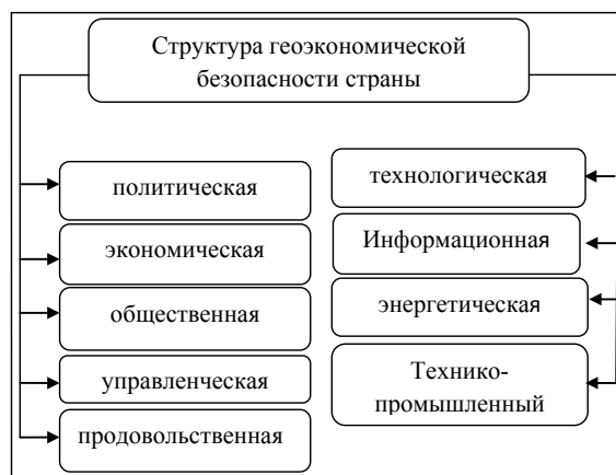
Рис. 1. Структура геоэкономической безопасности страны

В качестве базового методологического подхода используется метод конкретного случая [Case-study]. Концептуальный анализ ГЭБ малых стран с переходной экономики само по себе является научной новизной, а выдвижение концептуальных основ ГЭБ имеет практическое значение для формирования стратегии национальной безопасности Грузии.