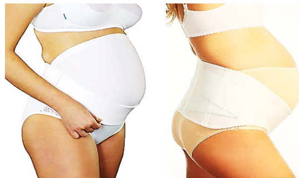
Рис. 3. Комбінований бандаж

Більшість жінок обирають бандаж-труси з естетичної точки зору, але цей варіант згодом виявляється не практичним, коли вагітна жінка усвідомлює необхідність покупки як мінімум ще однієї пари трусиків на зміну. Купівля комбінованого або бандажа-поясу буде більш раціональним рішенням як щодо вартості, так і щодо функціональності. Враховуючи той факт, що носіння бандажа після пологів допомагає швидше відновлюватися (фіксація внутрішніх органів) і сприяє швидкому втягуванню розтягнутої шкіри живота (естетичний ефект), то купівля комбінованого бандажа з естетичним зовнішнім виглядом здається найвигіднішим варіантом.