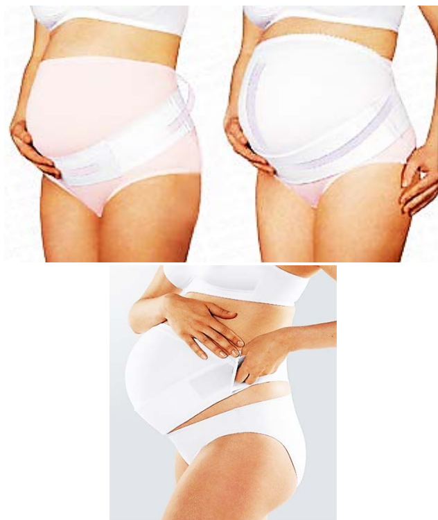
Рис. 2. Бандаж-пояс

Бандаж-пояс – вид допологового бандажа (рис. 2), який при посадці на тіло облягає область попереку і низу живота, фіксується за допомогою липучок [4].