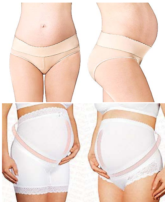
Рис. 1. Бандаж-труси

і «росте» разом з ним, не спричиняючи на нього тиску [4].