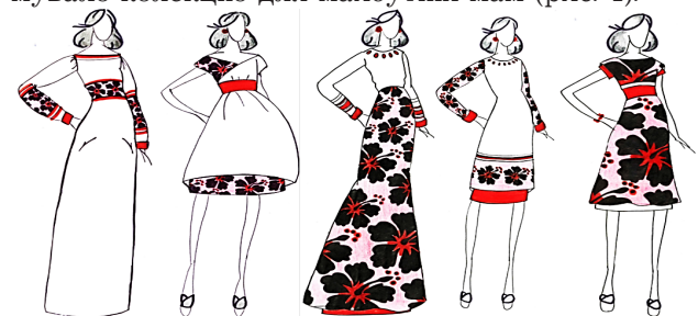
Рис. 4. Колекція функціонального одягу з підтримуючим ефектом для вагітних

Прагнення зробити саме таке враження сформувало колекцію для майбутніх мам (рис. 4).