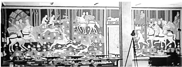
Рис. 2. Декоративне панно з гобеленів «Великокняже полювання» 1980 р. Т. Дмитренко, Л. Дмитренко

«Роль монументально-декоративного мистецтва в громадських будівлях, як пише А. Кантор, – це не абстраговане фантазування на вигадані і актуальні теми, не віртуозні варіації об'ємно-просторових побудов, а чи не сама важлива функція – знаходження шляху до людських сердець [3, с. 14]. Таким діалогом людини з мистецтвом є твори в готелі «Пролісок». В ресторані «Пролісок» з 1980 р. до сьогодні розміщені художньо-декоративні гобелени, виконані художниками Т. Дмитренко і Л. Дмитренко. На одній стіні декоративний текстиль зображує динаміку їзди верхи на конях вояків, біг собак і погоню за оленями в творі «Великокняже полювання» (1980 р.) (рис. 2). Стримані кольори надають в деякій мірі казковості цим творам, огортаючи відвідувачів роллю персонажів. На іншій стіні закомпонований твір з двох гобеленів – «Відпочинок» (1982 р.). Перший гобелен демонструє дівчину з палітрою, яка дивлячись на скульптуру, починає обмірковувати свій творчий мотив, а на другому – дівчата з юнаками відпочивають у парку, де хлопець грає на гітарі, налаштовую-