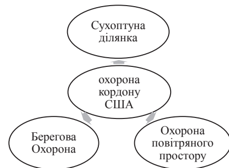
Рис. 1. Модель охорони кордону США

Говорячи про захист кордону США, слід зазначити, що прикордонна охорона здійснюється на сухопутній ділянці, на воді та у межах повітряного простору, рис. 1.