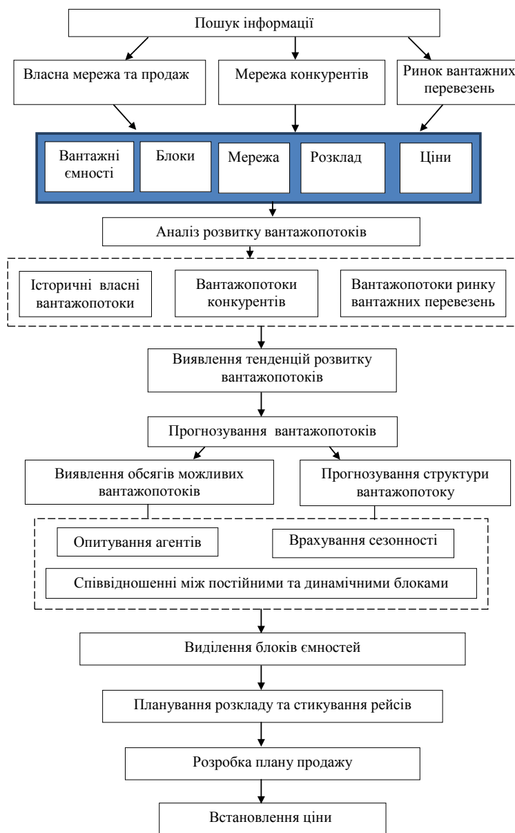
Рис. 1. Універсальна схема прогнозування вантажо потоків на мережі авіаліній

За результатами прогнозування відбувається послідовне: виділення блоків ємностей, планування розкладу та стикування рейсів, розробка плану продажу, а також встановлення ціни. Реалізація універсальної схеми прогнозування вантажо потоків на мережі авіаліній має спиратися на схеми прогнозів у довгостроковому, середньостроковому та короткостроковому періоді на мережі