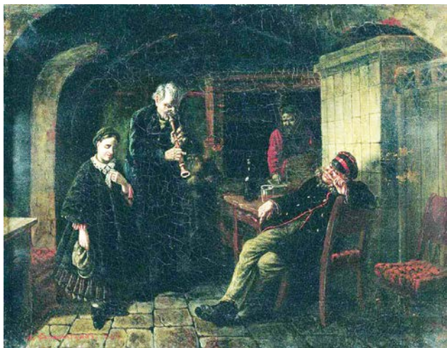
Рис. 5. Л.И. Соломаткин. «В погребке». 1864 г. // Государственная Третьяковская галерея (Москва)

Одна из известных картин «В погребке», посвященная этой теме, была написана еще в Академии, в 1864 году (рис. 5) [4, с. 24].