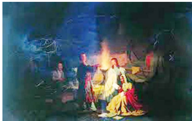
Рис. 6. Л.И. Соломаткин. «Актеры на привале». 1869 г. // Государственный Русский музей (Санкт-Петербург)

Продолжает тему картина «Актеры на привале» (1869) (рис. 6) [4, с. 26].