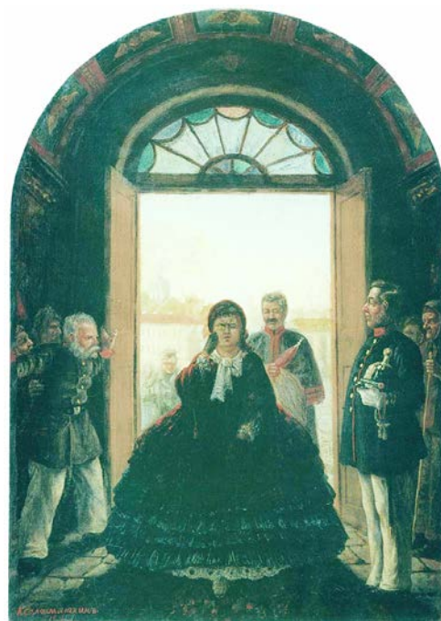
Рис. 3. Л.И. Соломаткин. «Губернаторша, входящая в церковь». 1864 г. // Государственный Эрмитаж (Санкт-Петербург)

Героям повстречались на пути молодая женщина и девушка. Естественно и типично поведение «охотников», остановившихся поболтать от скуки [4, с. 23]. В 1864 году были написаны «С молебном», «Выход архимандрита», «Плящущий монах», в 1865 – «Купец читает Апостола в церкви», в 1866 – «Старый быт» [4, с. 23]. Священнослужители для художника – это особый, колоритный тип обывателя, и художник мягко, беззлобно посмеивается над их человеческими слабостями, отмечая забавность ситуаций и не особенно затрагивая социальную суть явления.