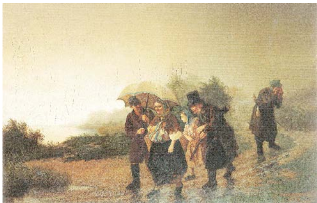
Рис. 4. Л.И. Соломаткин. «Возвращение с охоты». 1863 г. Х., м., 58,0 X 89,0 см // Киевский национальный музей русского искусства (Украина)

Героями его картин становятся отставные генералы, купцы, служители церкви и рядовые обыватели – «маленькие люди», жизнь которых художник мог ежедневно наблюдать на улице [4, с. 23]. Художник, действительно, много времени проводил вне стен Академии, изучая великие полотна в Эрмитаже, а также в трактирах и кабаках. В любом случае тема одиночества маленького человека в большом городе, проходящая через многие полотна художника, была ему близка. После ухода из Академии, художник продолжил разрабатывать заявленные ранее темы в рамках одной главной – «маленьких людей», вместивших в себя всю сложность противоречивого мира [4, с. 24]. Персонажами нескольких картин стали бродячие артисты.