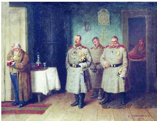
Рис. 2. Л.И. Соломаткин. «Городовые-христославы». 1872 г. // Пермская государственная картинная галерея (Пермь)

В «Именинах дьячка» (1862) представлена будничная сцена. Накрыт стол у окна: самовар, ватрушки, вино. Видны часть печи, стул, ходики... Это неперменные атрибуты интерьера Л.И. Соломаткина – не в такой ли комнате он вырос? Комната опрятная и уютная. Вполне возможно, именно так и жил тот самый дьячок из детства, учивший художника читать и писать. Жесты и позы героев картины естественны. Прекрасно справился художник и с колоритом: цвета передают настроение праздника. Л.И. Соломаткин увидел сам и передал зрителю красоту простой будничной жизни.