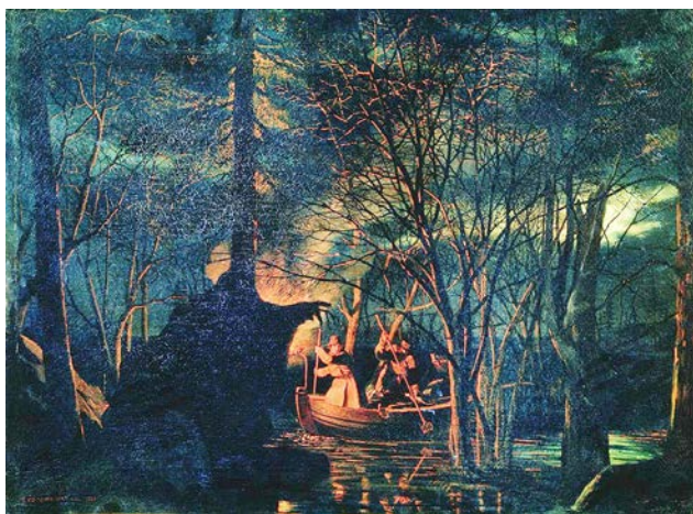
Рис. 9. Л.И. Соломаткин. «Рыбная ловля острогой ночью». 1867 г. // Государственный Русский музей (Санкт-Петербург)