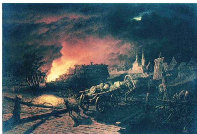
Рис. 10. Л.И. Соломаткин. «Пожар ночью в селе». 1877 г. // Государственный Эрмитаж (Санкт-Петербург)

Вторая половина 1870 – начало 1880-х годов были тяжелыми в жизни Л.И. Соломаткина. Он уже не выставлял свои картины на продажу. Говорили, что художник пристрастился к вину. Что было тому причиной: одиночество, творческая неудовлетворенность или человеческое безволие – теперь можно только гадать. Он скитался по улицам города, оставаясь порой голодным и без ночлега. И, как всегда, передавал свои переживания, горький жизненный опыт в картинах. Трагичной тематике художник посвятил целый ряд произведений (на примере картины «Утро у трактира» (1873)) (рис. 11) [4, с. 33].