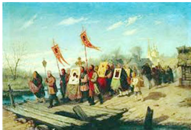
Рис. 12. Л.И. Соломаткин. «Крестный ход». 1882 г. // Национальный художественный музей Республики Беларусь (Минск)

ее ценность, полуслепой, он нащупал ее смысл – в труде, в самой жизни, небе и земле, и это все чуть ли не целиком поместилось на картине.