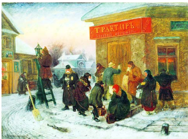
Рис. 11. Л.И. Соломаткин. «Утро у трактора». 1873 г. // Иркутский областной художественный музей имени В.П. Сукачева (Иркутск)

ми – они не вписывались в модное современное направление живописи. Впрочем, пресса уже и не упоминала имени художника. Последняя картина Л.И. Соломаткина – «Крестьянин с сохой» была датирована 1883 годом [4, с. 40].