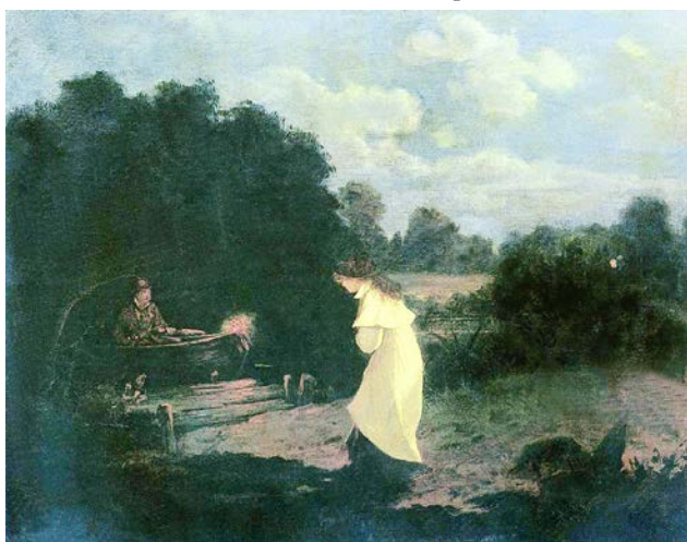
Рис. 8. Л.И. Соломаткин. «Свидание». 1880 г. // Государственный русский музей (Санкт-Петербург)

заява, и их глупые лица также похожи на маски. Картина «шумная», большую ее часть занимают пляшущие гости, но зрителю, как и художнику, тревожно и даже страшно. Такое же впечатление оставляют другие картины Л.И. Соломаткина, посвященные праздникам и, казалось бы, радостным событиям в жизни человека – «Невеста», «Свадьба», «Свидание» (рис. 8) [4, с. 28].