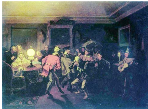
Рис. 7. Л.И. Соломаткин. «Ряженые». 1873 г. // Государственный Русский музей (Санкт-Петербург)

В 1873 году появилась картина «Ряженые» (рис. 7) [4, с. 26].