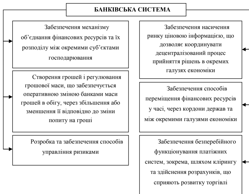
Рис. 1. Напрями впливу банківської системи на фінансову сферу

лятор. З одного боку, ліквідація неплатоспроможних банків та банків, які порушували українське законодавство, повинно позитивно вплинути на прозорість банківської системи. З іншого боку, надмірне зменшення учасників банківського сектору може призвести до погіршення конкурентного середовища та умов надання банківських продуктів.