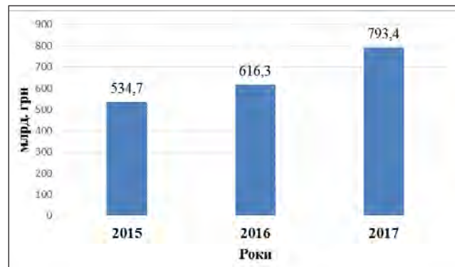
Рис. 1. Доходи Державного бюджету за 2015-2017 роки, млрд. грн

Якщо порівнювати доходи державного бюджету за 2015-2017 роки, варто зазначити, що спостерігається позитивна динаміка. Адже, у 2015 році обсяг Державних доходів становив 534,7 млрд. грн, у 2016 році – 616,3 млрд. грн., а у 2017 році – 793,4 млрд. грн.