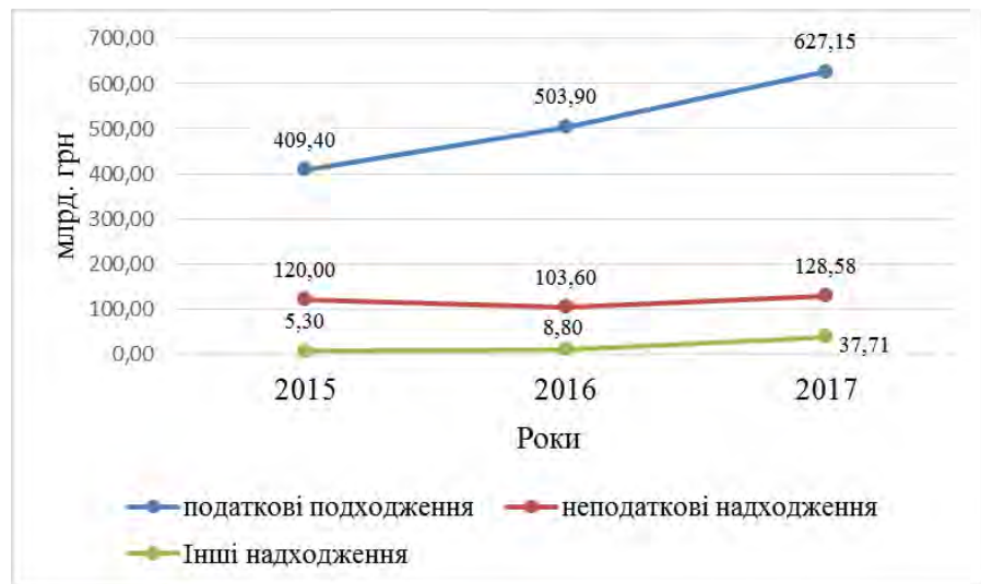
Рис. 2. Надходження до Державного бюджету за 2015-2017 роки, млрд. грн Джерело: розроблено авторами за даними [4]

Одним із індикаторів, що свідчить про неефективність бюджетного менеджменту України є державний борг. Наведемо інформацію щодо державного та гарантованого державою боргу України у таблиці 1.