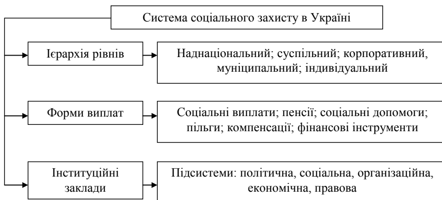
Рис. 1. Складові системи соціального захисту населення в Україні

Фінансування системи соціального захисту в Україні здійснюється з державного бюджету та фондів загальнообов'язкового державного соціального страхування (рис. 2).