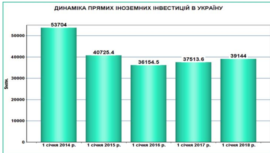
Рис. 1.2. Динаміка прямих іноземних інвестицій України за 2014-2018 рр.