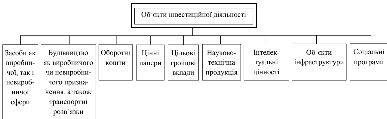
Рис. 1.1. Класифікація об'єктів інвестиційної діяльності

В Україні іноземні інвестиції є визначальною передумовою розвитку національної економіки та важливим індикатором умов підприємницької діяльності, саме тому виникає необхідність зосередити увагу на питаннях іноземного інвестування. Особливої гостроти проблеми іноземного інвестування набувають саме зараз, коли україн-