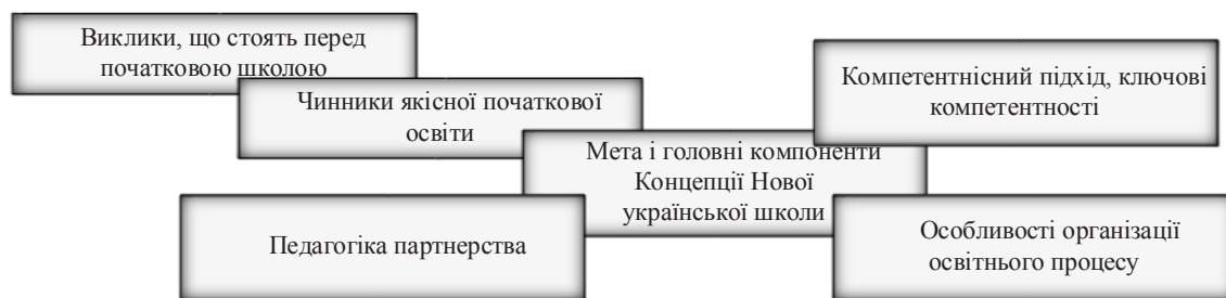
Рис. 1. Концепція нової української школи