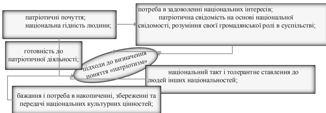
Рис. 2. Сучасні погляди на підходи щодо визначення поняття «патріотизм»