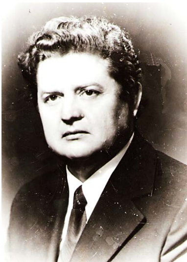
Фото 1. Віктор Мірошніченко

Віктор Панасович Мірошніченко своїми коренями був міцно пов'язаний з національною театральною культурою. Закоханий у рідний край, у нашу самобутню українську культуру, він більшу частину свого життя жив і працював в Полтаві, саме тут до нього прийшло визнання.