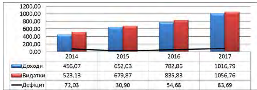
Рис. 1. Динаміка доходів і видатків Державного бюджету України, млрд. грн.

З метою визначення шляхів збільшення та раціонального використання дохідної бази державного бюджету проведемо аналіз його доходів. Як бачимо з табл. 1, основною часткою доходів Державного бюджету України протягом всього досліджуваного періоду залишаються податкові надходження які становлять близько 80% усіх доходів. Протягом останніх чотирьох років спостерігається позитивна тенденція до їх зростання. Загальна сума податкових надходжень у 2017 р. порівняно з 2014 р. зросла на 346,97 млрд. грн. (123,84%), причому надходжен-