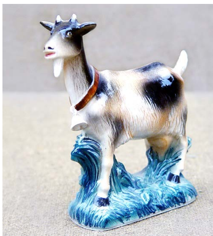
Рис. 8. Кізонька, 2001, зб. худ.

«Фарко» 9 зі Слов'янська. Основне виробництво на фірмі було вже налагоджено, підприємці хотіли запустити у виробництво лінію ексклюзивного фарфору подарункового асортименту і запропонували художнику зайнятися організацією даної справи. О. Трегубов переїхав до Слов'янська (1995), і продовжив працювати в улюбленому матеріалі, створювати унікальні вироби та фарфорову пластику. На базі виробничого кооперативу «Фарко» протягом 1995-1997 років він створив вази, чайний сервіз «Аріель», жанрову і аніمالістичну скульптуру.