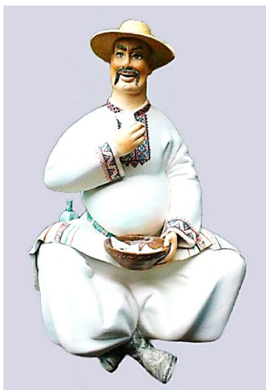
Рис. 9. Чумак, зб. художника

Потім побудував власну майстерню і працював як приватний підприємець (1999-2010), а нині – як вільний художник. Розробляв вази, фігурні штюфи, жанрову і аніمالістичну скульптуру («Кізонька», 2001; рис. 8), а наймані працівники за його зразками відтворювали невеликий тираж для продажу. До малотиражних виробів відноситься серія антропоморфних скриньок. Композиційно вони представляють доволі традиційну