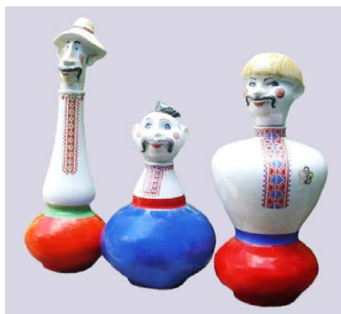
Рис. 4. Набір штофів: Панас, Кіндрат, Левко 1985, збірка художника

«Кіндрат» і «Левко» (1985; у виробництві йшли малим тиражем – рис. 4), миску «Ватра», кухоль «Крокус», чайно-кавовий сервіз «Арабіка», декоративні вази «Орфей» і «Глорія», тощо [1, с. 55]. Розроблені художником на БФЗ вироби з 1983 по 1986 роки експонувалися на п'яти республіканських виставках 6 і одній міжнародній. Фігурні штофи «Панас», «Кіндрат» і «Левко» були представлені в експозиції розділу УРСР на Виставці Радянського союзу в Аргентині у 1986 році.