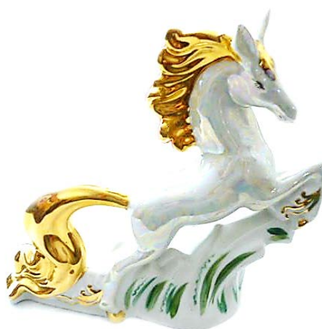
Рис. 7. Кінь (Золота грива), 1984, приват. зб.