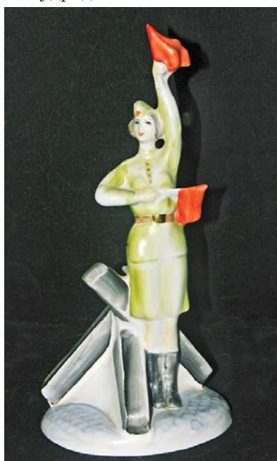
Рис. 5. Регулювальниця, 1985, зб. худ.

ті часи виготовлялася на БФЗ окремими обмеженими партіями, лише за спеціальними замовленнями, переважно до державних свят. Так, до 40-річчя перемоги СРСР над фашистською Німеччиною було розроблено скульптурні композиції на історичну тематику: « Регулювальниця » (рис. 5) і « Василь Тьоркін » (випускалися невеличкими тиражами) та сучасну – « Дід з онуком » (затверджена худрадою, в тираж не пішла) (всі – 1985 року). Дві скульптурні композиції були створені на казкову тематику. Скульптура « Іван-царевич » (1984; малюнок «Ошатний»; рис. 6), що зображує вершника із жар-птахом, через складність виготовлення випускалася одиничними екземплярами. Для і малого тиражу скульптуру спростили – прибрали вершника із птахом, залишивши лише коня , і в такому вигляді випускали з 1984 року. Вдалою з боку відчуття специфіки фарфорової пластики є анімалістично-казкова скульптура « Кінь » за мотивами казки «Коник-горбоконики» (1984, малюнок «Золота грива»; рис. 7). Художник стилізує характерний рух тварини, його хвіст та гриву, добре узгоджує її із постаментом. З робіт в анімалістичному жанрі слід згадати також скульптуру « Півень » (зберігається в Слов'янському краєзнавчому музеї; далі – СКМ). Яскравою декоративністю відзначається скульптурна композиція на етнографічну тему « Бандурист » (1992; СКМ) [2, с. 15], яка теж у виробництво не пішла, хоч і була затверджена заводською худрадою.