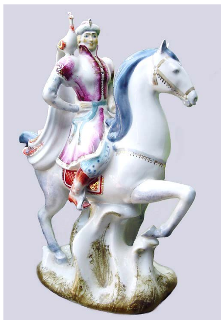
Рис. 6. Іван-царевич, 1984, зб. худ.

фарфорової пластики стилізація, умовність кольорової гами. Естетично вони цілком вписуються в коло українських пластичних творів з фарфору тієї доби. Резюмуючи роботу О. Трегубова у сфері малої пластики на БФЗ, констатуємо, що в матеріалі було втілено вісім скульптур, а у виробництво пішли лише три. Зрозуміло, що художнику було психологічно складно працювати в умовах відсутності перспектив реалізації своїх творчих прагнень. Не дивно, що він покинув роботу на підприємстві, коли видалася така можливість, а випуск скульптури на БФЗ після його уходу майже остаточно згас. Лише з десятків шаржованих під анімалістику творів сувенірного плану було випущено заводом на останньому етапі його існування 8 .