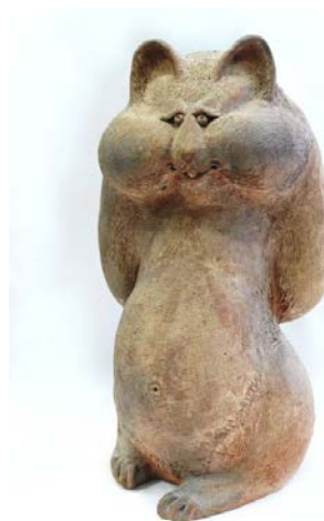
Рис. 1. Хом'як, 1978, СОХМ