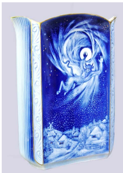
Рис. 12. Благівість, зб. худ.