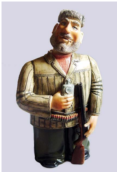
Рис. 10. Мисливець, зб. худ.

керамічну плитку, він також створив невеличкі живописні панно розміром 30 x 30 см: «Пірат» (2010), «Гномик» (2010), «Садко», «Колядки», «Зберігач часу», де виступив як дивовижний майстер-оповідач і тонкий рисувальник. Ці роботи візуально особливо близькі до акварельного живопису, яким теж останніми роками плідно займається майстер.