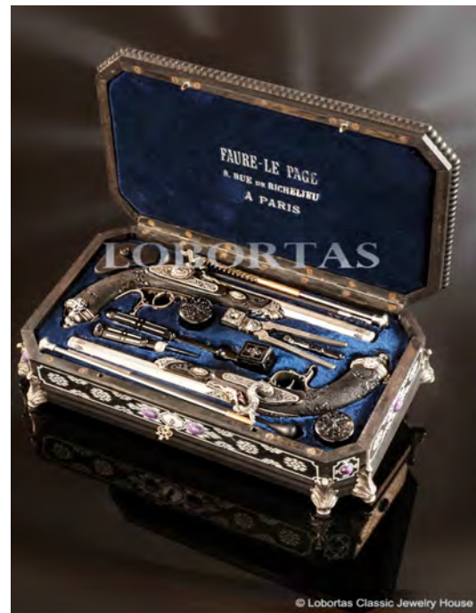
Ил. 9. Пара дуэльных пистолетов Faure-Le Page. Оружейная миниатюра.

Вторая категория интерьерных ювелирных композиций – изделия, выполняющие как эстетические, так и утилитарные функции, в современных условиях чаще всего используемые для оформления деловых интерьеров и имеющие статус кабинетных украшений. Однако их история довольно богата, апогей популярности приходится примерно на к. XIX – нач. XX вв., что во многом тоже обусловлено расцветом деятельности фирмы К. Фаберже. Ассортимент весьма богат, но часть из изделий той эпохи уже вышла из употребления, поэтому в современном мире заменена на другие, отвечающие запросам времени. Большой популярностью пользовались вполне функциональные письменные