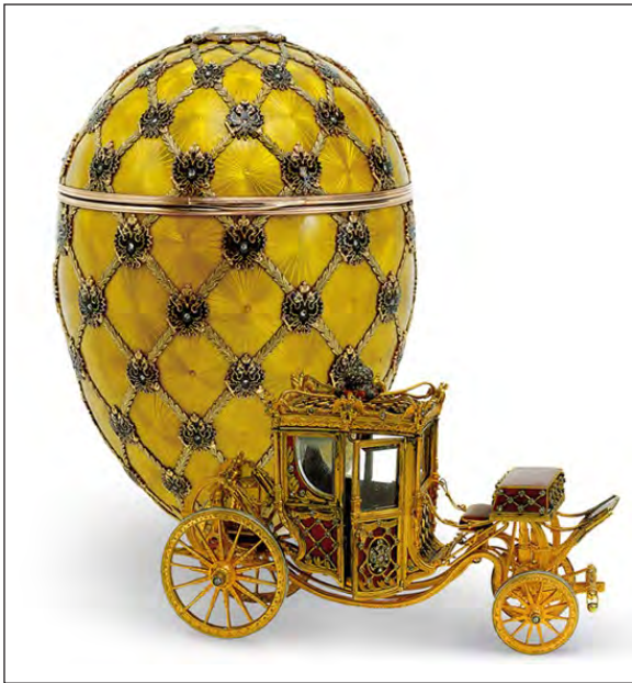
Ил. 7. Пасхальное яйцо «Коронационное». М. Перхин, Г. Штейн. Фирма К. Фаберже, 1896 г. Золото, платина, серебро, алмазы, хрусталь, бархат, эмаль