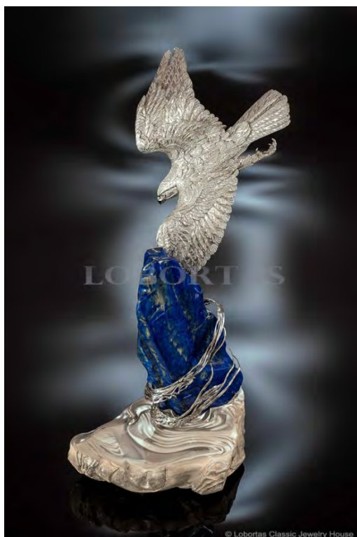
Ил. 2. «Сокол». Классический ювелирный дом «Лобортас». Серебро, золото, бриллианты, топазы, лазурит, пейзажный кремний