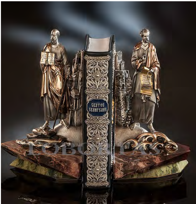
Ил. 10. Подставка для книг «Петр и Павел». Классический ювелирный дом «Лобортас». Серебро, золото, черные бриллианты, унакит, яшма