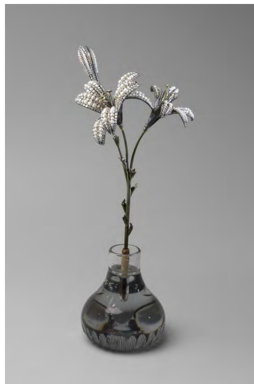
Ил. 4. «Ветка лилий в вазе». Мастерская Дювалей, 1790-е гг. Серебро, золото, жемчуг, бриллианты, алмазы, хризолиты, стекло, медь