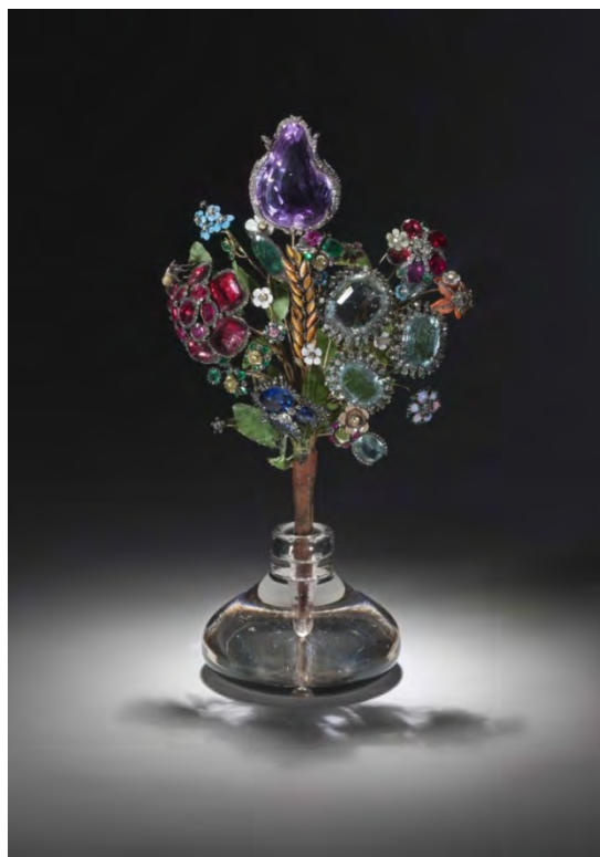
Ил. 3. «Букет цветов». И. Позье. 1740-е гг. Золото, серебро, бриллианты, топазы, аквамарины, рубины, сапфиры, изумруды, агаты, тигровый глаз, кахолонг, яшма, стекло, ткань