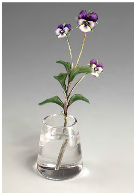
Ил. 5. «Анютины глазки». Г. Вигстрем. Золото, алмазы, нефрит, горный хрусталь, эмаль