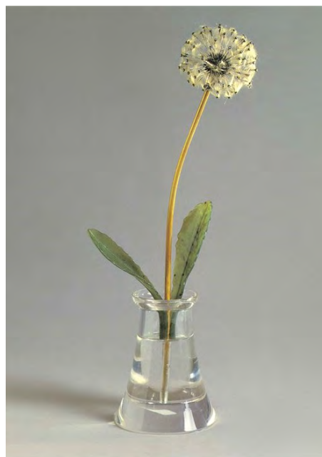
Ил. 6. «Одуванчик». К.-Г. Фаберже. 1914–1917 гг. Золото, нефрит, бриллианты, горный хрусталь, пух одуванчика

Обращались мастера при изготовлении таких композиций и к древесным мотивам – могли воспеть в металле и камне, например, ветки березы с сережками, бонсай («Бонсай», Г. Вигстрем, ок. 1907-1908 гг., золото, эмаль гильоше, нефрит, агат, яшма, кварц), к ягодам (не раз обгрывались малина, морошка, земляника). Среди ювелирных ягодных композиций, например, «Ветка черники» (фирма К. Фаберже, 1880-е гг., золото, нефрит, лазурит, горный хрусталь), «Ветка красной смородины» (фирма К. Фаберже, н. XX в., золото, нефрит, эмаль, горный хрусталь), др. Многие из этих подарочных ювелирных композиций украшали столы русских императриц и княжен, часть впоследствии перекочевала в музеи Западной Европы (Дрезден, Баден-Баден), часть – в коллекцию английской королевы, некоторые постепенно возвращаются обратно в Петербург.