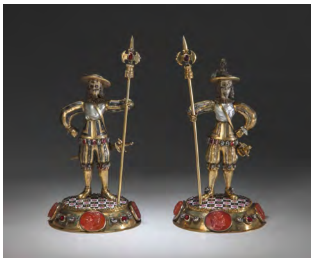
Ил. 1. «Алебардисты» . Неизвестный мастер, нач. XVIII в., Германия. Позолоченное серебро, алмазы, алмандины, барочный жемчуг, сердоликовые камей, эмали