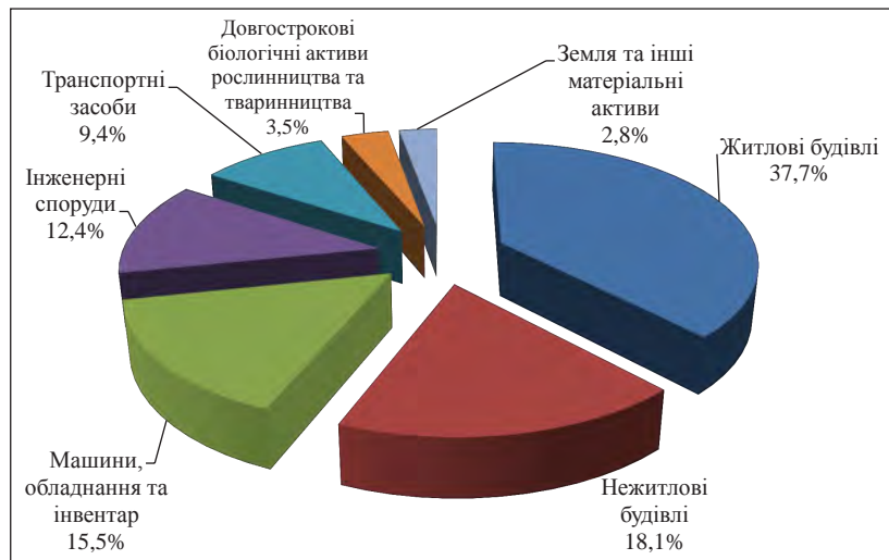
Рис. 1. Структура капітальних інвестицій в матеріальні активи за січень-вересень 2017 року

Основний тягар усіх капітальних інвестицій у області лягає саме на населення. Дані вкладення за своєю природою є пасивними, таким чином, вони ніяк не впливають на розвиток економіки регіону, а отже, і на економіку країни загалом. Це є великою проблемою, оскільки Чернівецькій області необхідні саме іноземні інвестиції для розвитку всіх галузей господарського комплексу, особливо тих, які б сприяли розширенню експортної бази, підвищенню технічного та технологічного рівня виробів, організацій імпортозамінних виробництв. За статистикою іноземні інвестори вкладають кошти у створення нових підприємств, а не в розвиток уже існуючих.