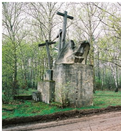
Рис. 1. Памятники ПМВ в дер. Ст. Войковичи Барановичского р-на Брестской обл.