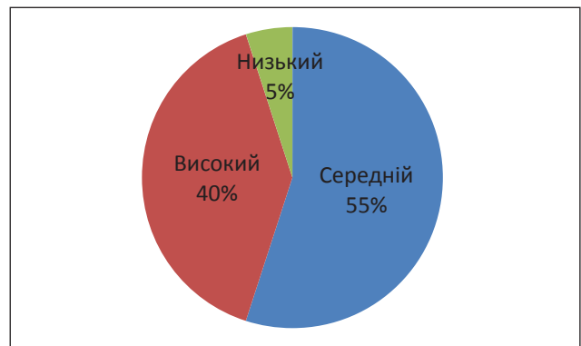
Рис. 4. Результати діагностичної методики Н.Холла в експериментальній групі на констатуючому етапі експерименту

З рисунку 4 видно, що в експериментальній групі високий рівень емоційного інтелекту мають 40% дітей, середнім – 55%, низьким – 5%. У контрольній групі 25% підлітків з високим емоційним інтелектом, 50% із середнім і 25% з низьким показником емоційного інтелекту.