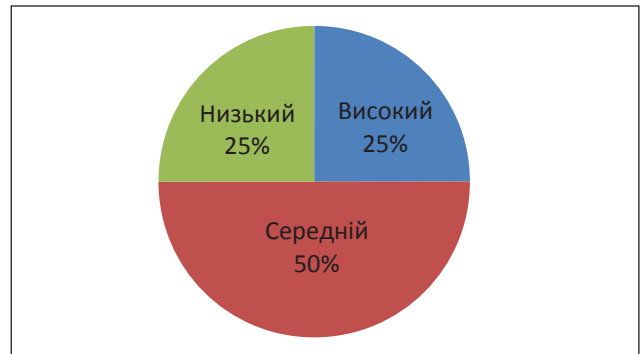
Рис. 3. Результати діагностичної методики Н. Холла в контрольній групі на констатуючому етапі експерименту

На контрольному етапі експерименту ми провели підсумкову діагностику емоційного інтелекту у підлітків в контрольній та експериментальній групах за допомогою тих же методик, що і на констатуючому етапі експерименту.